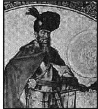
Michel Le Brave

Des tentatives de résistance à la domination ottomane éclatent encore à la fin du XVI ème siècle. Ainsi le voïvode Michel, installé en Valachie par ses maîtres turcs qui l'apprécient comme bon administrateur, entre soudain dans la "Sainte Ligue" anti-ottomane formée autour du pape par l'Empereur d'Autriche, l'Espagne, des princes allemands et italiens, avec Sigismond Bathory, prince de Transylvanie, et même le voïvode de Moldavie ! Les troupes impériales pénètrent au Banat, puis en Valachie, les troupes de Michel massacrent de nombreux Turcs (2000 tués à Bucarest), enfin les alliés franchissent le Danube et envahissent la Bulgarie. Mais les Ottomans, grâce au général Sinan Pacha, contre-attaquent, exercent de dures représailles à Bucarest. Une nouvelle offensive occidentale permet de rétablir la situation.