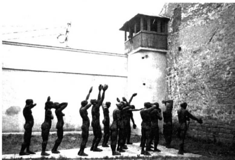
Mémorial des martyrs du communisme de Sighet