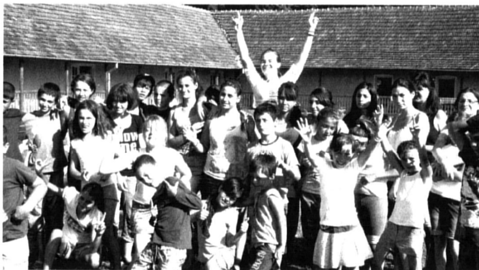
Les enfants du lycée gréco catholique